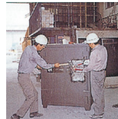
耐熔断・耐工具防盜試験 TRTL

※1 金庫を主とした鋼製家具類の製造・販売等を行う事業連合会。業界内における金庫に関する耐火や防盜など性能基準を設定している。