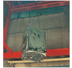
急加熱・衝撃落下併用性能試験