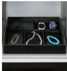
アクセサリートレー