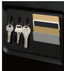
鍵フック/カードホルダー