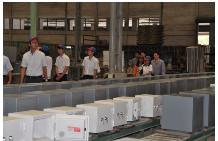
暑い工場内の天井には巨大な扇風機が何台も