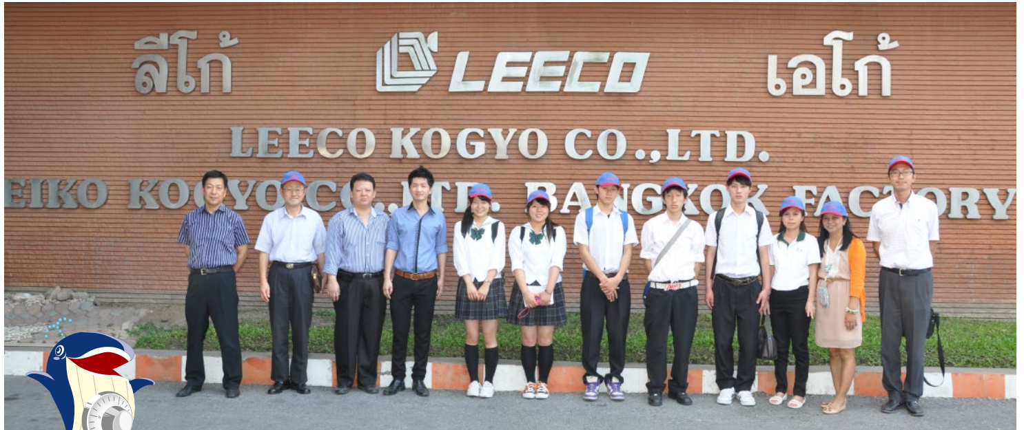
異国の地までご来社いただきありがとうございました。

日本とタイ王国の高校生が文化交流を深める「日タイ交流事業」でタイへ訪れた際に、タイバンコク工場 (LEECO KOGYO CC.,LTD.) にご来訪頂きました。