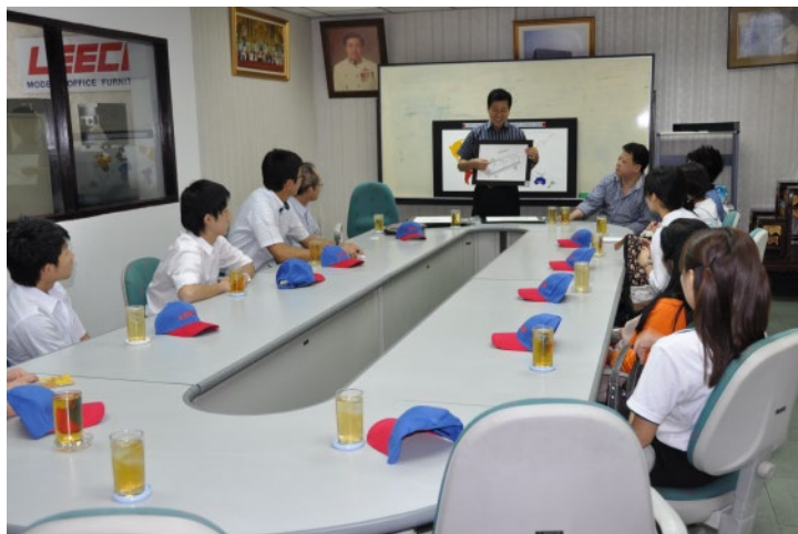
触れる機会が少ない金庫 興味を持って頂けたでしょうか？