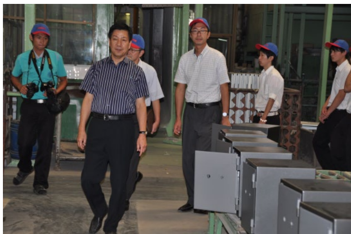
広大な生産ラインの見学風景